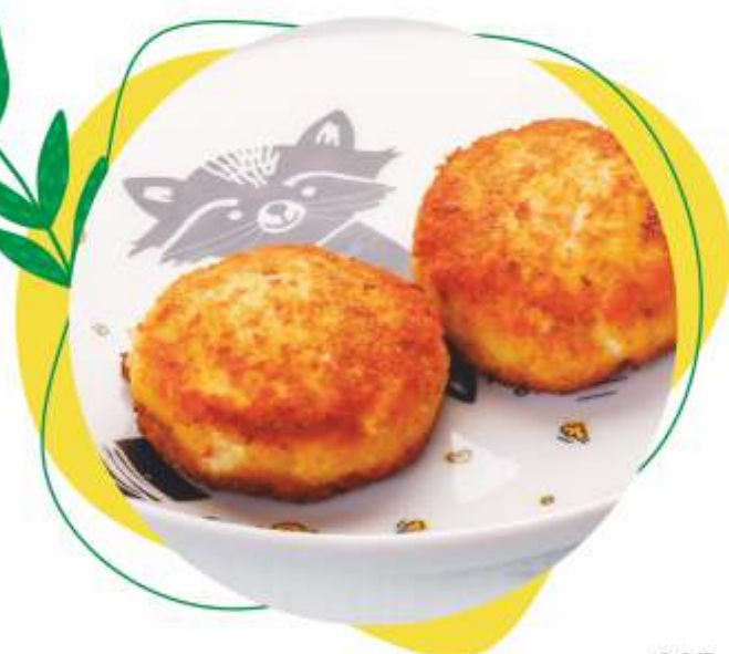
РЫБНЫЕ КРОКЕТЫ 100 г 165.-