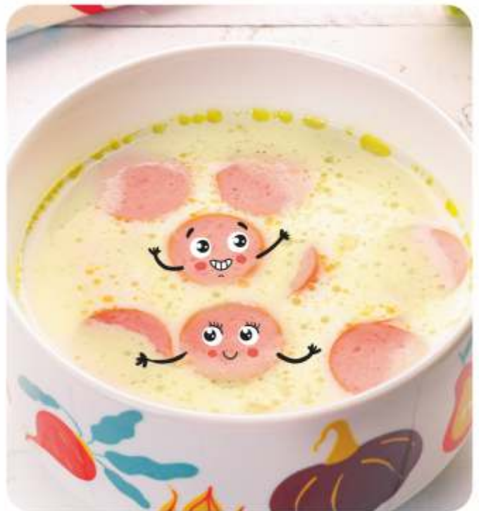
КРЕМ-СУП КАРТОФЕЛЬНЫЙ С СОСИСКАМИ