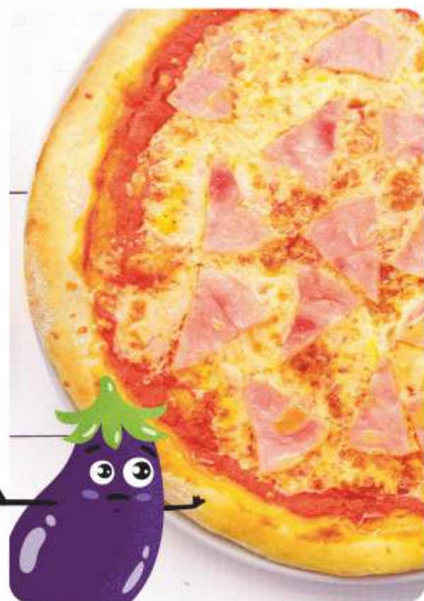
ПИЦЦА С ВЕТЧИНОЙ И СЫРОМ