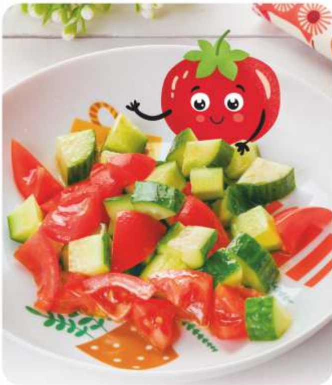
ОВОЩНОЙ ИЗ ОГУРЧИКОВ И ТОМАТОВ