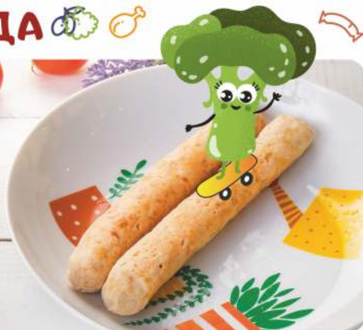
ДОМАШНИЕ СОСИСКИ КУРИНЫЕ 100 г 155.-