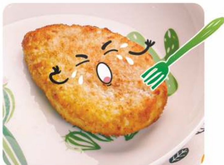
КОТЛЕТКА КУРИНАЯ ЖАРЕНАЯ 100 г 155.-