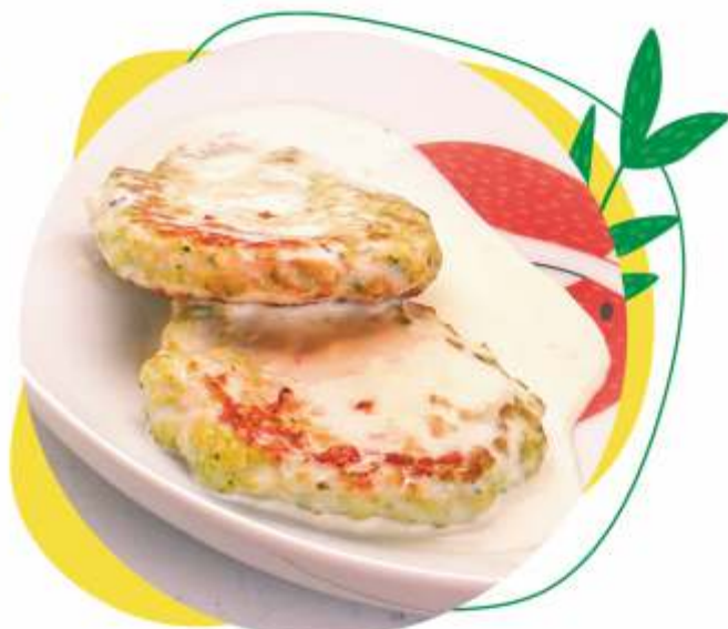
КОТЛЕТКИ КУРИНЫЕ С БРОККОЛИ 100 г 175.-