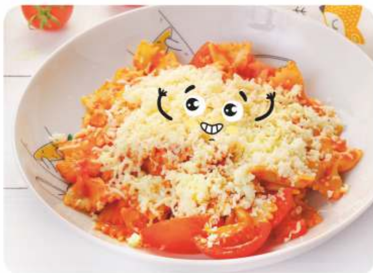
ПАСТА С ТОМАТАМИ И СЫРОМ