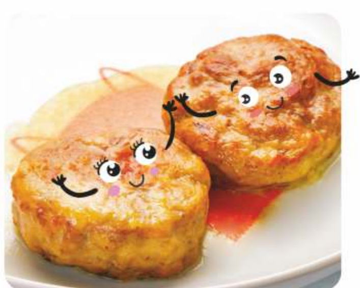
БИТОЧКИ МЯСНЫЕ 100 г 145.-