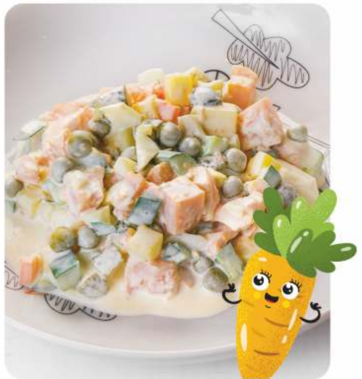
ОЛИВЬЕ С КУРОЧКОЙ