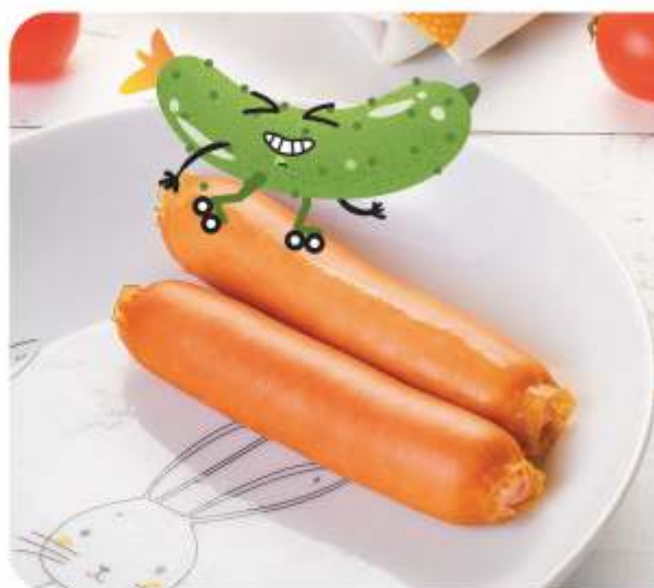
СОСИСКИ ПРЕМИУМ 100 г 155.-